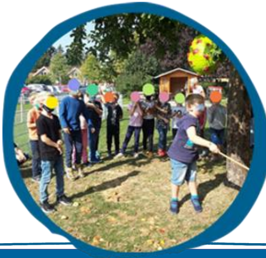
Corona-Piñata , OGS Nordkirchen